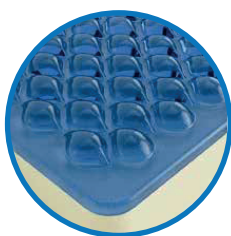
TECNOLOGÍA THERAGEL Y THERAULTRA