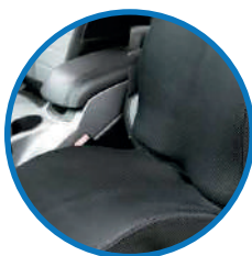
DISEÑO 2 EN 1