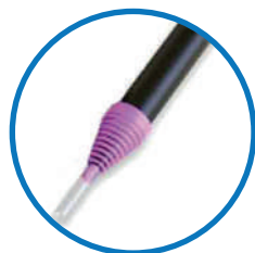
VÁLVULA DE INFLADO