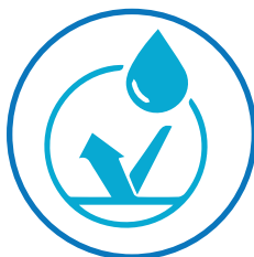
FUNDA IMPERMEABLE HIPOALERGÉNICA